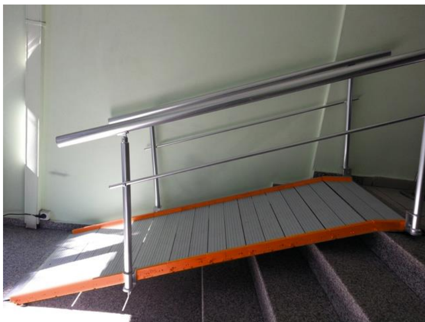
Rambardes et pieds disponibles en option (sur devis)