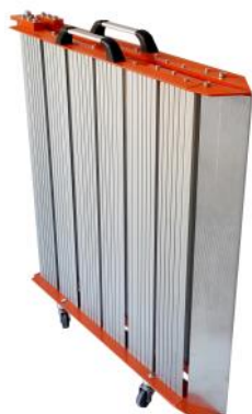
Pieds fournis à partir de 2 m

Entièrement pliable, elle se range aisément dans un placard en attendant d'être utilisée