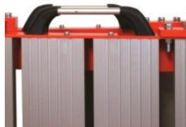
Poignées de portage

Ne portez plus votre plateforme, roulez la !